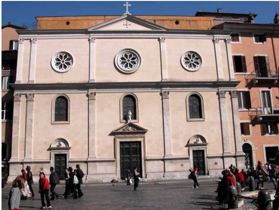
Chiesa di Nostra Signora del Sacro Cuore- Roma