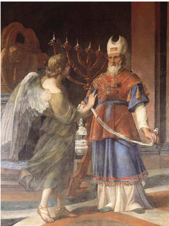
Andrea Sacchi, Annunciazione di S. Zaccaria, XVII sec.

Zaccaria si spaventa e pensa che non sia possibile tutto questo. La vita, però, è dono di Dio.